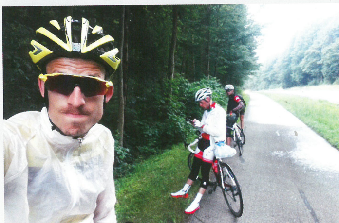
Hledání na booking pod stromy v dešti