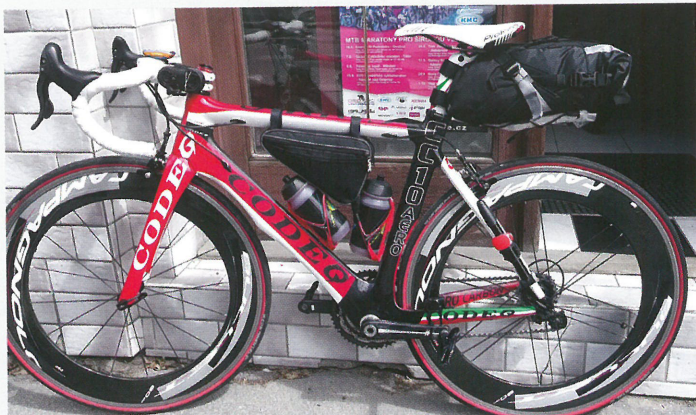
Plně vybavené kolo včetně digitálního centra ukrytého v rámové brašně (powerbanka s kabelem a wi-fi). Majitel těsně před odjezdem vysoké ráčky nahradil nižším profilem kvůli obavě z bočního větru.