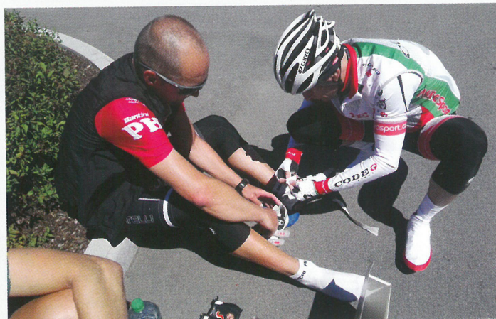
Vložení podložky do tretry